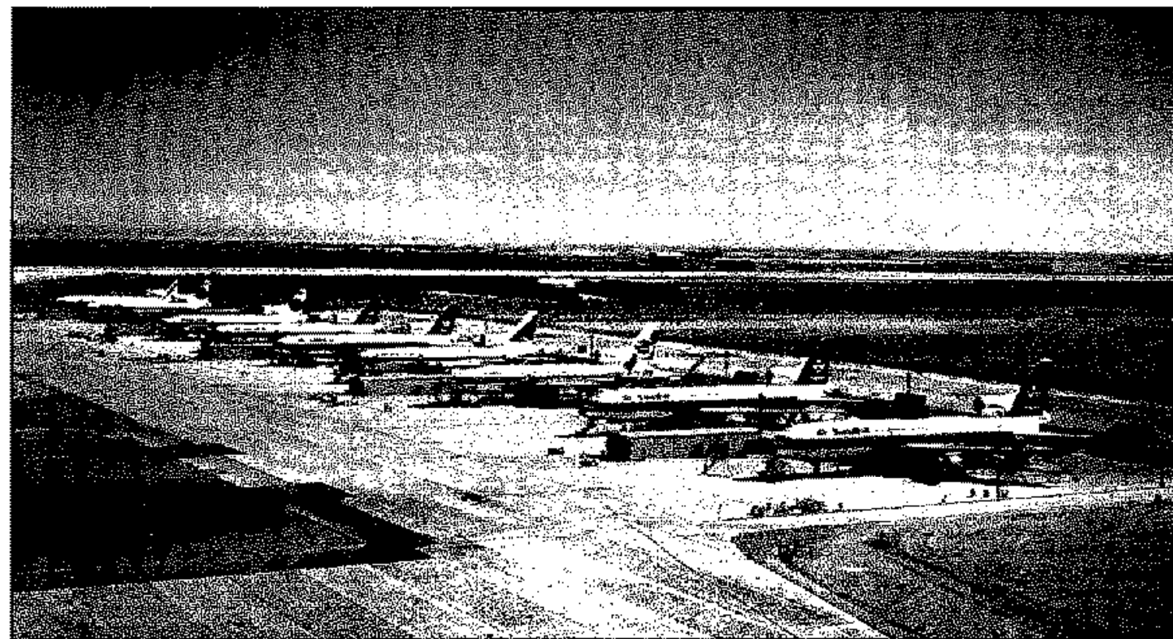
A linha de montagem final em Palmdale

No início de 1968 a Lockheed tinha já o design definitivo do avião, sendo então designado de L1011-385, um modelo com capacidade para 250 passageiros, motores de 37